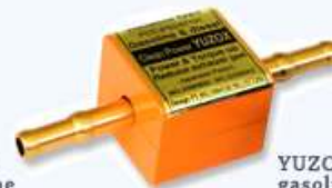
YUZOX for gasoline engine