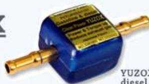
YUZOX for diesel engine